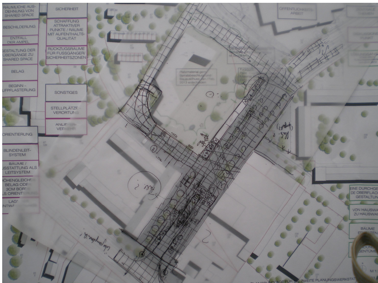
Arbeitsergebnis Gruppe 1